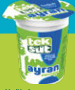
Yarım Yağlı Ayran Half Fat Yoghurt Drink