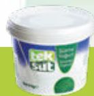
Süzme Yoğurt Strained Yoghurt