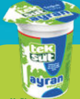
Yarım Yağlı Ayran Half Fat Yoghurt Drink