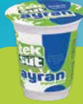
Ayran Yoghurt Drink